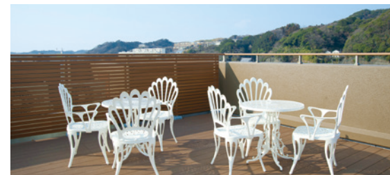
大空と眺望を楽しめる屋上テラス