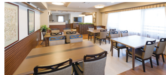
大きな窓に面し明るさいっぱいのダイニング（食堂）