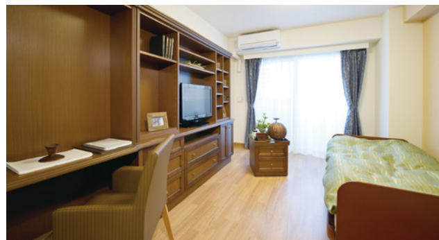
お気に入りの家具を持ち込める居室（モデルルーム）

安心してお過ごしいただけるよう、緊急コールを各室とトイレに設置し、車椅子のご利用にも配慮しています。