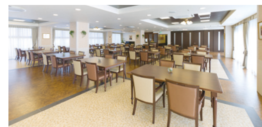
大きな窓に面し明るさいっぱいのダイニング（食堂）