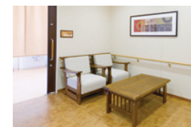
お風呂上がりにくつろげる 湯上がりコーナー