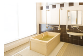
ゆったりとした気分で入れる ヒノキ風呂