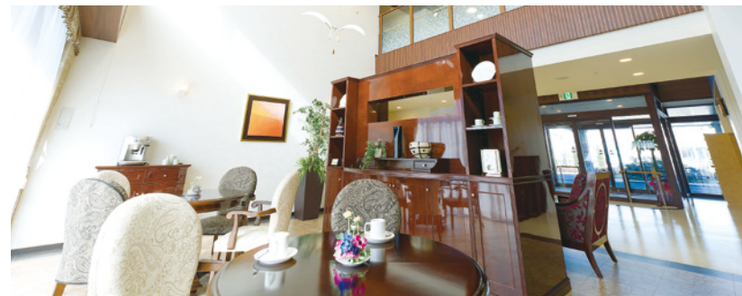
思い思いにお過ごしいただけるカフェ

ゆったりとしたダイニング（食堂）や思い思いに過ごせるカフェなど、 日常的にゆとりと癒しを実感できる共用空間・設備をご用意しています。