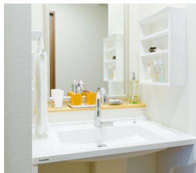
清潔感のある洗面化粧台を各室に設置