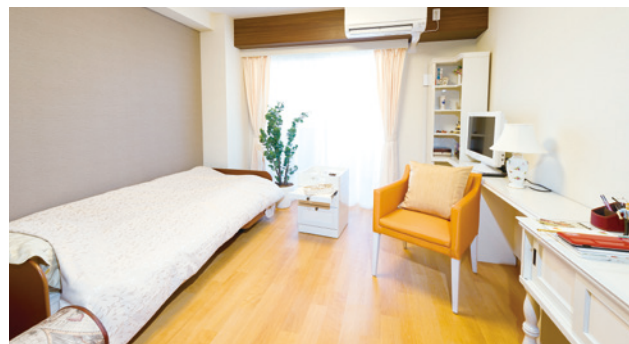
お気に入りの家具を持ち込める居室（モデルルーム）

安心してお過ごしいただけるよう、緊急コールを各室とトイレに設置し、車椅子のご利用にも配慮しています。