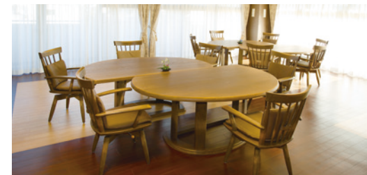
ご入居者さまの憩いの場となるラウンジ