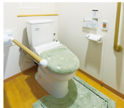
車椅子でも使いやすいトイレ