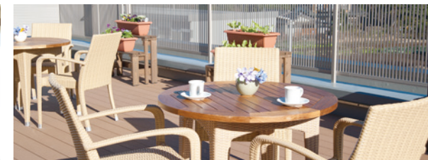
ご入居者さま同士での会話やティータイム、読書などを楽しめる開放感 いっぱいのウッドデッキテラス