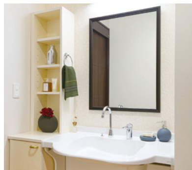
清潔感のある洗面化粧台を各居室に設置