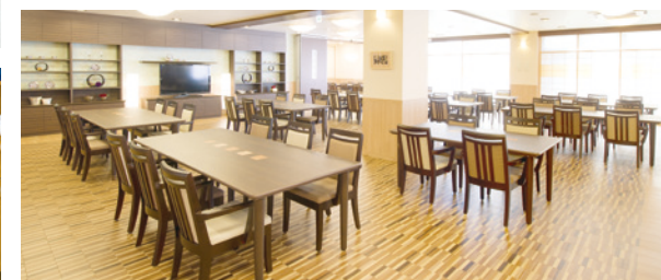
大きな窓に面し明るさいっぱいのダイニング（食堂）