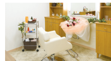
いつまでも美しくいていただくための 理美容室