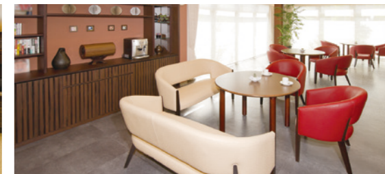
ご入居者さま同士の歓談などにお使いいただけるカフェ