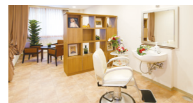
ご入居者さまや訪問されたご家族をゆったりと 迎えられる「和」テイストのエントランスロビー いつまでも美しくいただくための理美容室 二面採光で明るさいっぱいダイニング(食堂)