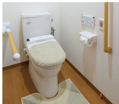
車椅子でも使いやすいトイレ