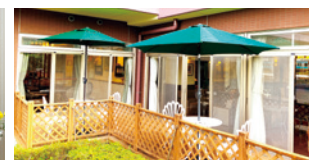
さわやかな風が通り抜けるテラス