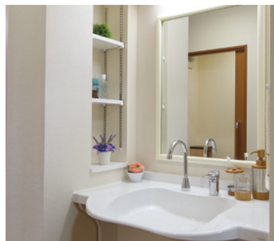
清潔感のある洗面化粧台を各室に設置