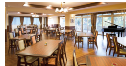
二面採光で明るさいっぱいのダイニング（食堂）