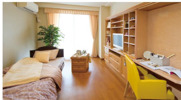
お気に入りの家具を持ち込める居室（モデルルーム）

安心して過ごしていただけるよう、緊急コールを各室とトイレに設置し、車椅子のご利用にも配慮しています。