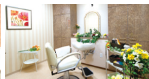
いつまでも美しくいていただくための理美容室