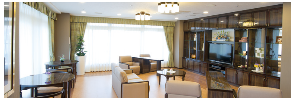
開放的なラウンジをはじめご入居者さまに心地よくお過ごしいただける共用スペース

窓の大きなダイニング（食堂）や各階に設けたラウンジをはじめ、日常的にゆとりと癒しを実感できる共用空間・設備をご用意しています。