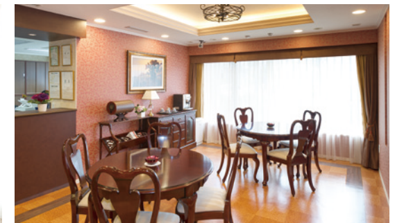
思い思いにお過ごしいただけるカフェ