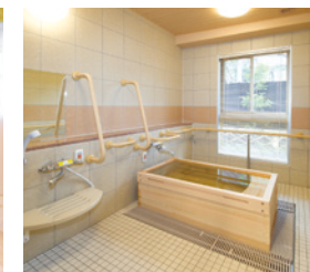
ゆったりとした気分で入れる ヒノキ風呂