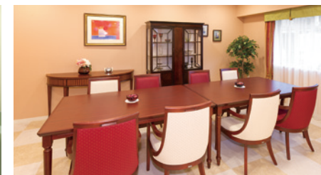
訪問されたご家族と和やかなひとときを過ごせる ファミリーダイニング