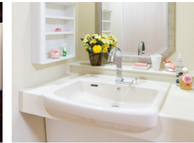
清潔感のある洗面化粧台を各室に設置