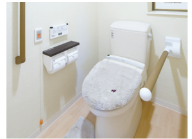
車椅子でも使いやすいトイレ