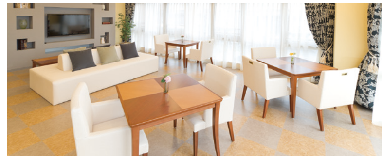
落ち着いたラウンジをはじめご入居者さまに心地よく過ごしていただける共用スペース

窓の大きなダイニング（食堂）や各階に設けたラウンジをはじめ、日常的にゆとりと癒しを実感できる共用空間・設備をご用意しています。