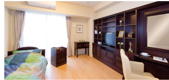
お気に入りの家具を持ち込める居室（モデルルーム）

安心して過ごしていただけるよう、緊急コールを各室とトイレに設置し、車椅子のご利用にも配慮しています。