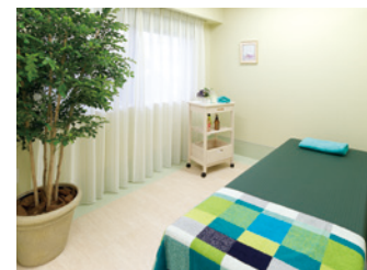
心も身体もリフレッシュしていただける マッサージコーナー