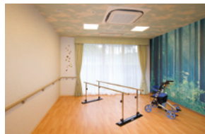
機能訓練や生活リハビリも しっかりサポート