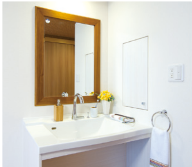
清潔感のある洗面化粧台を各室に設置