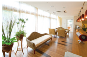
思い思いにお過ごしいただける カフェ