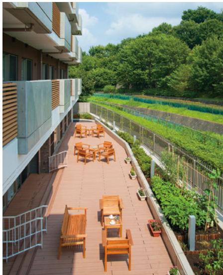
ご入居者さま同士での会話やティータイム、読書などを 楽しめる開放感いっぱいのウッドデッキテラス