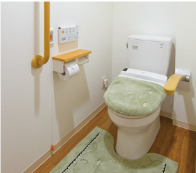
車椅子でも使いやすいトイレ