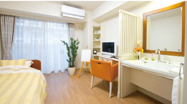
お気に入りの家具を持ち込める居室（モデルルーム）

安心してお過ごしいただけるよう、緊急コールを各室とトイレに設置し、車椅子のご利用にも配慮しています。