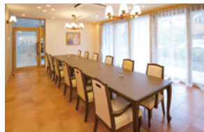
訪問されたご家族と和やかなひとときを 過ごすファミリーダイニング