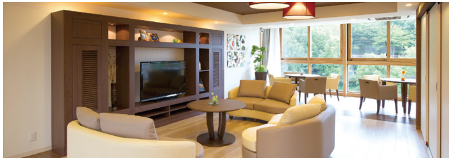
ご入居者さまの憩いの場となるラウンジ

ゆったりとしたダイニング（食堂）や思い思いに過ごせるカフェなど、 日常的にゆとりと癒しを実感できる共用空間・設備をご用意しています。