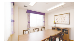
個室としてもご利用いただける 相談室