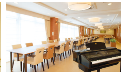
二面採光で明るく開放感たっぷりのダイニング（食堂）