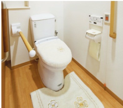
車椅子でも使いやすいトイレ