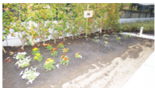
色とりどりの花や植物を育てる農園