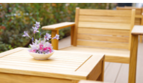
陽光とそよ風を楽しむ ウッドデッキテラス