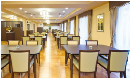
二面採光で明るく開放感たっぷりのダイニング（食堂）