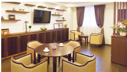
思い思いにお過ごしいただけるカフェ