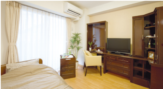
お気に入りの家具を持ち込める居室（モデルルーム）

安心してお過ごしいただけるよう、緊急コールを各室とトイレに設置し、車椅子のご利用にも配慮しています。