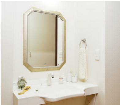
清潔感のある洗面化粧台を各室に設置