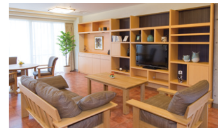
思い思いにお過ごしいただけるラウンジ