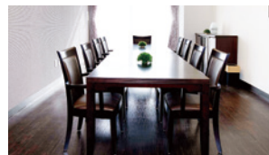
落ち着いた雰囲気の相談室