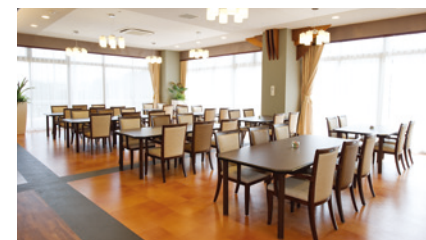
二面採光で明るく美しい眺望も楽しめるダイニング（食堂）