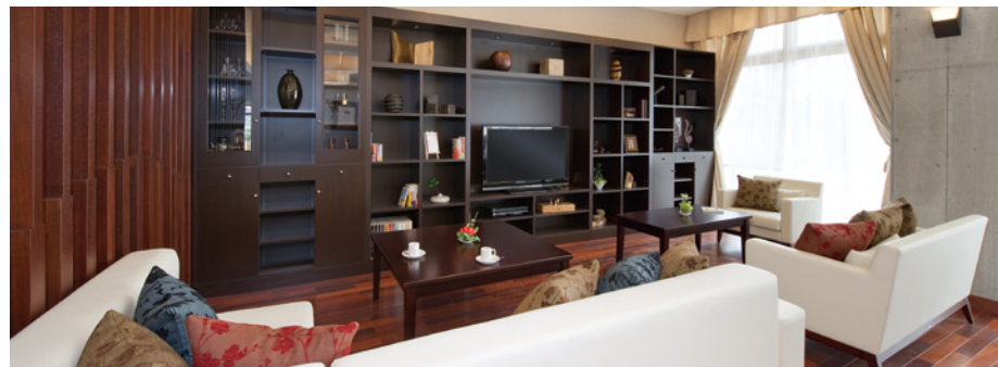
落ち着いたラウンジをはじめご入居者さまに心地よくお過ごしいただける共用スペース

庭に面したダイニング（食堂）や居室階に2つずつ確保したラウンジをはじめ、日常的にゆとりと癒しを実感できる共用スペース・設備をご用意しています。