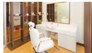
いつまでも美しくいていただくための理美容室