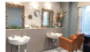
いつまでも美しくいていただくための理美容室