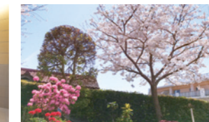
四季折々の花に彩られた中庭