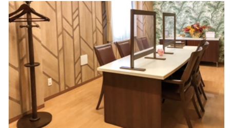
明るく落ち着いた雰囲気の写真室