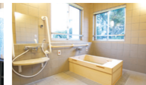
ゆったりとした気分に入れるヒノキ風呂