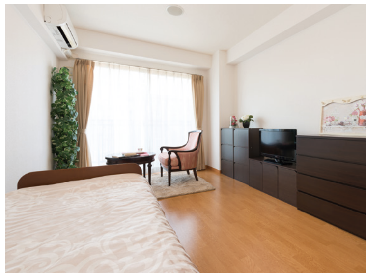
お気に入りの家具を持ち込める居室（モデルルーム）