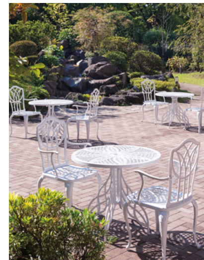
ご入居者さま同士での会話やティータイム、 読書などを楽しめる開放感いっぱいのテラス