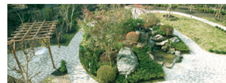
心身を癒す緑いっぱいの庭園