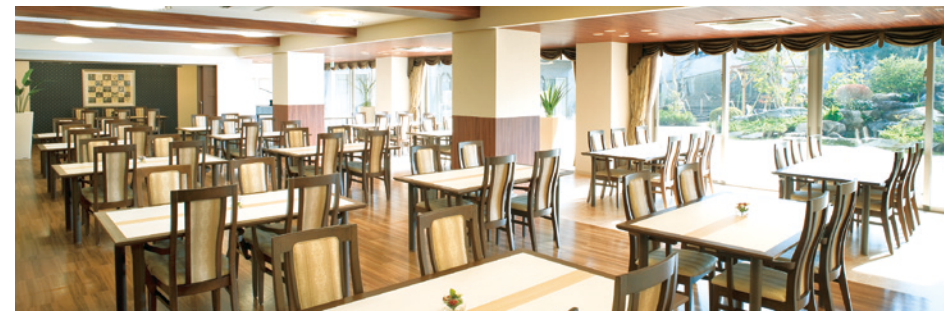
大きな窓から陽光が差し込む、明るさいっぱいのダイニング

ゆったりとしたダイニング（食堂）や思い思いに過ごせるカフェなど、 日常的にゆとりと癒しを実感できる共用空間・設備をご用意しています。