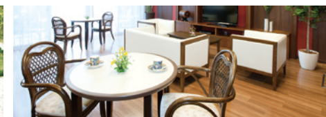
ご入居者さまの憩いの場となるラウンジ