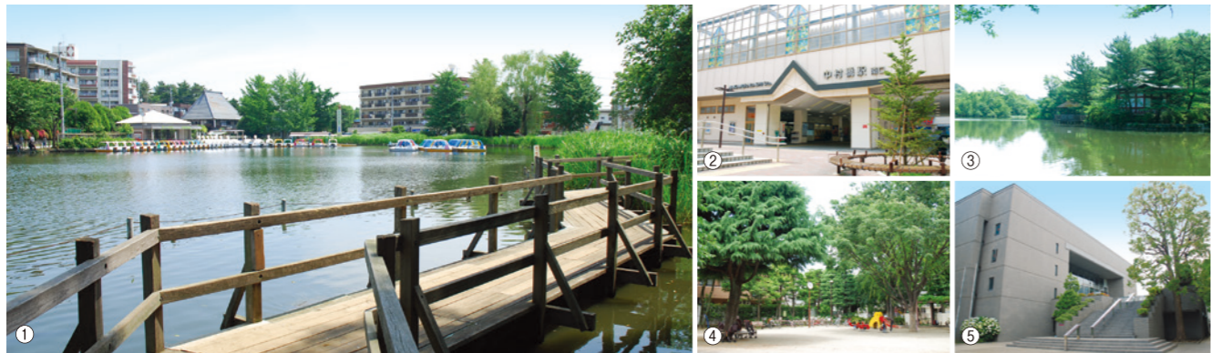
①都立石神井公園 ②中村橋駅 ③巖島神社 ④中村公園 ⑤練馬区立美術館

都心へのアクセスが至便でありながら武蔵野の面影を強く残す街、中村橋。「都立石神井公園」「石神井池から三宝寺池にかけて豊かな自然が広がり、住民の憩いの場となっています。」「石神井城跡」「巖島神社」「南蔵院」などの歴史遺産や、美術館も点在し、街に深い趣を添えています。日常のお買い物は近隣の「いなげや」をはじめ、中村橋駅前の「サンツ中村橋商店街」がサポート。自然のうらおいと利便性を享受する豊かな生活環境です。