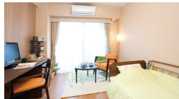
居室(モデルルーム)

お気に入りの家具を持ち込んでいただき、ご自分らしい インテリアで楽しんでいただける居室。安心してお過ごし いただけるよう、緊急コールを各室に設置しております。