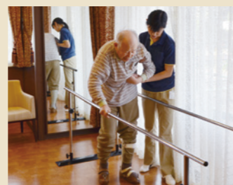
リハビリの様子(イメージ)