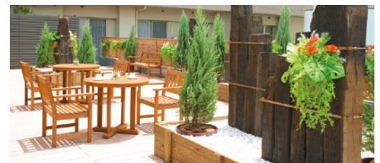
ウッドデッキテラス