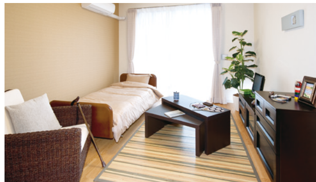
居室(モデルルーム) ※居室変更については、「入居についてのご案内」の「居室変更」欄に記載があります。

お気に入りの家具を持ち込んでいただき、ご自分らしいインテリアで楽しんでいただける居室。安心してお過ごしいただけるよう、緊急コールを各室、トイレに設置し、車椅子の利用にも配慮しています。