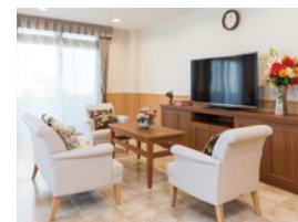
ご入居者さまどうしでの 会話が弾むラウンジ