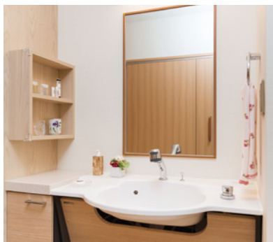
清潔感のある洗面化粧台を各居室に設置