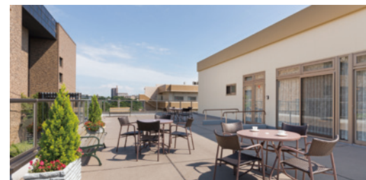
さわやかな風につつまれるルーフバルコニー