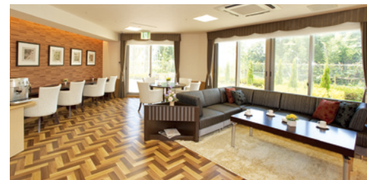
歓談や読書など思い思いにお過ごしいただけるカフェ