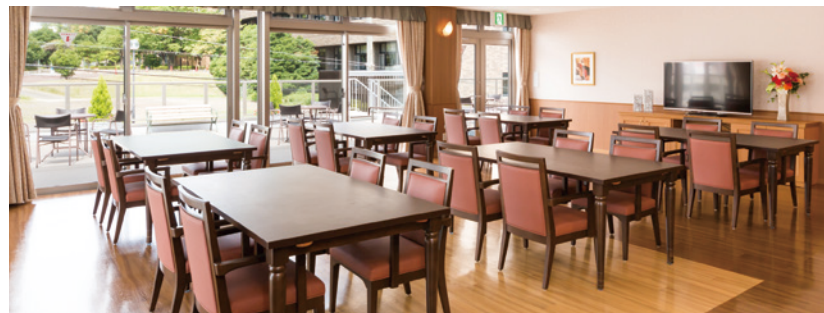
大きな窓から陽光が差し込む、明るさいっぱいのダイニング

ゆったりとしたダイニング（食堂）や思い思いに過ごせるカフェやラウンジ。 日常的にゆとりと癒しを実感できる共用空間・設備をご用意しています。