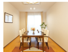
ご家族さまとのひとときをお楽しみ いただけるファミリーダイニング