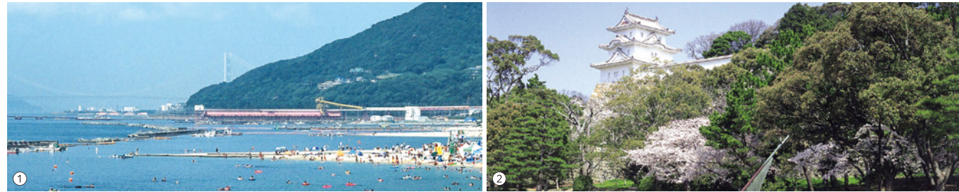
①須磨海浜公園 ②明石公園 (C)明石観光協会 ③本松寺・妙見社のツツジ (C)明石観光協会 ④明石駅 ⑤神戸学院大学 有瀬キャンパス

源氏物語の舞台として有名な、須磨・明石。千年の時を超えて、その美しい自然や季節感は日本人の心に訴えかけます。伊川谷は、神戸のベッドタウンとして人気の高い、西神戸丘陵の南端「大蔵谷」に続く地域です。ホーム近隣には、神戸学院大学キャンパスをはじめ各種専門店が点在し、利便性にも優れた快適な生活環境です。