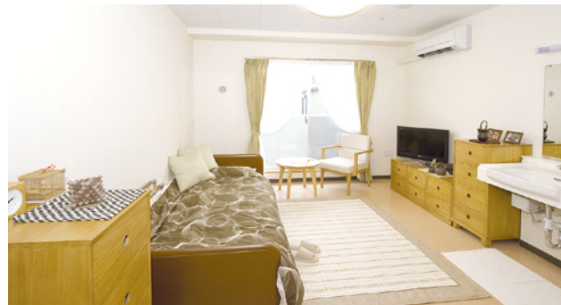
居室 (モデルルーム) ※居室変更については、「入居についてのご案内」の「居室変更」欄に記載があります。

お気に入りの家具を持ち込んでいただき、ご自分らしいインテリアで楽しんでいただける居室。安心してお過ごしいただけるよう、緊急コールを各室、トイレに設置し、車椅子の利用にも配慮しています。