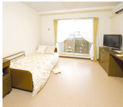
居室 (モデルルーム)