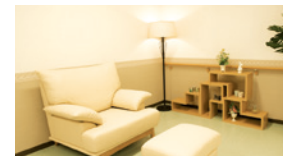
マッサージコーナー