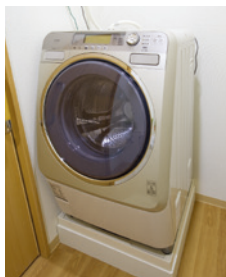
全居室に洗濯機を設置

お気に入りの家具を持ち込んでいただき、ご自分らしいインテリアで 楽しんでいただける居室。車椅子の利用にも配慮し、安心してお過ごし いただける設備を各所に配しました。