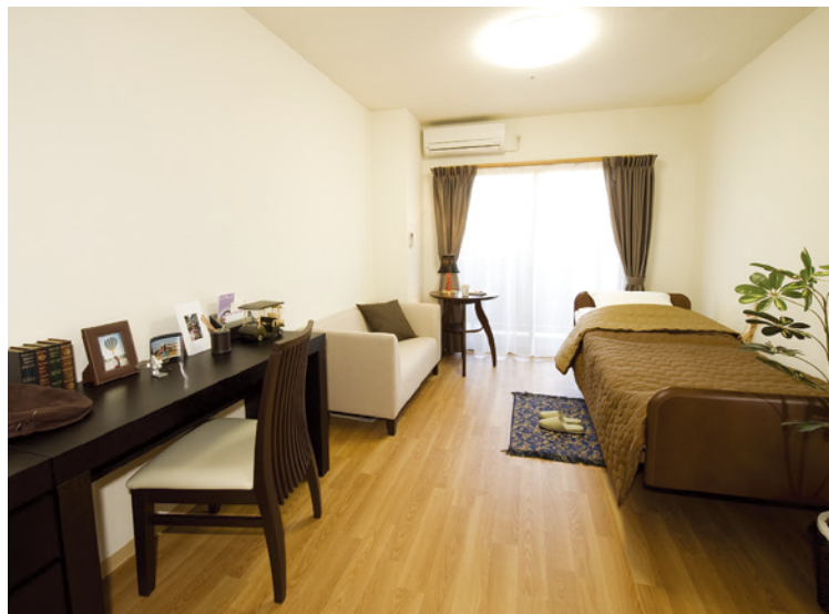
居室（モデルルーム） ※居室変更については、 「入居についてのご案内」の「居室変更」欄に記載があります。

プライバシーに配慮し、全居室に洗濯機を設置しました。お好きな 時間にご自分でお洗濯できるほか、生活リハビリの一環としてケア スタッフがお手伝いさせていただきながらの洗濯も行っています。