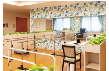
リハビリコーナー