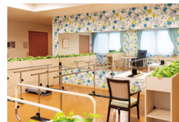
リハビリコーナー