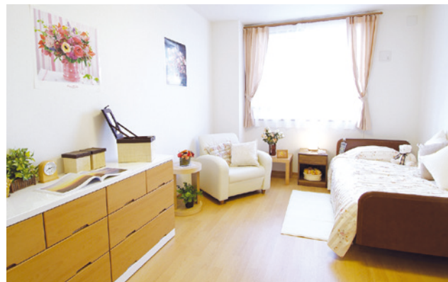
居室(モデルルーム) ※居室変更については、「入居についてのご案内」の「居室変更」欄に記載があります。

お気に入りの家具を持ち込んでいただき、ご自分らしいインテリアで楽しんでいただける居室。 安心してお過ごしいただけるよう、緊急コールを各室、トイレに設置し、車椅子の利用にも配慮しています。