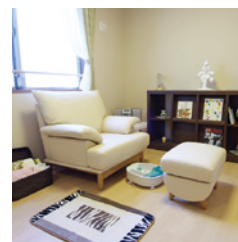
マッサージルーム