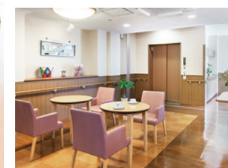
多目的コーナー（1階）