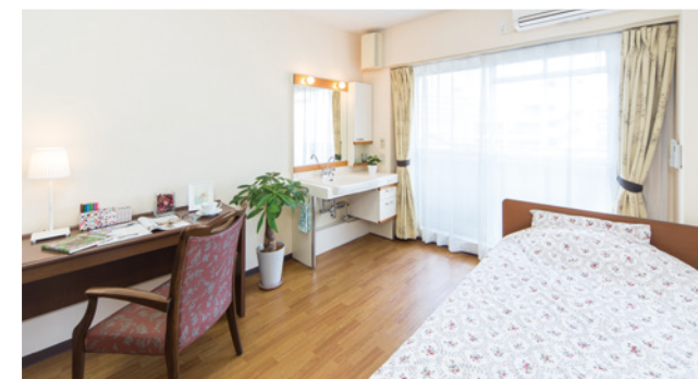
居室（モデルルーム）

お気に入りの家具を持ち込んでいただき、ご自分らしいインテリアで楽しんでいただける居室。たっぷりとする収納庫も備えております。安心してお過ごしいただけるよう、緊急コールを各室、トイレに設置し、車椅子の利用にも配慮しています。