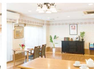
多目的コーナー（2階）