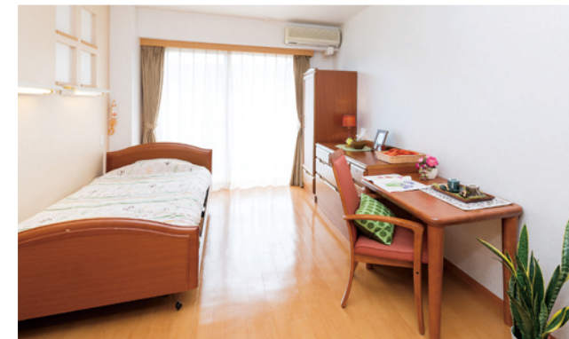
居室（モデルルーム）

お気に入りの家具を持ち込んでいただき、 ご自分らしいインテリアで楽しんでいただける居室。 たっぷりとする収納庫も備えております。 安心してお過ごしいただけるよう、緊急コールを各室、 トイレに設置し、車椅子の利用にも配慮しています。