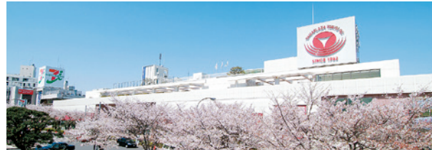
たまプラーザ駅前