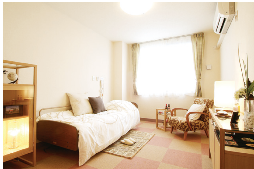
居室（モデルルーム）※居室変更については、「入居についてのご案内」の「居室変更」欄に記載があります。

お気に入りの家具を持ち込んでいただき、 ご自分らしいインテリアで楽しんでいただける居室。 安心して過ごしていただけるよう、 緊急コールを各室、トイレに設置し、車椅子の利用にも 配慮しています。