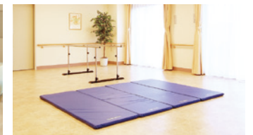
機能訓練コーナー