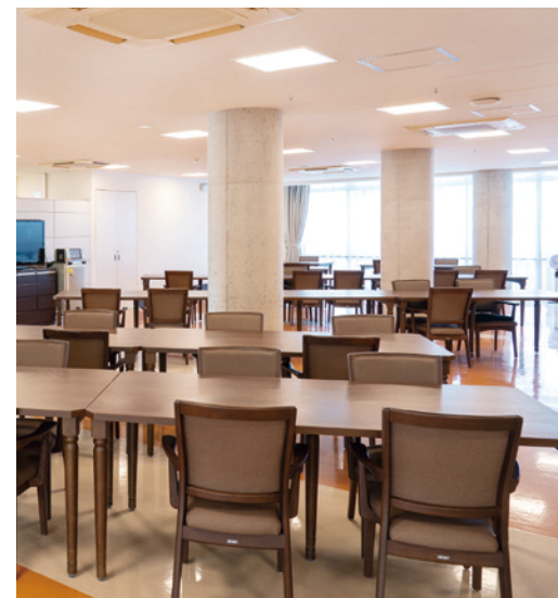
大きな窓から陽光が差し込む、明るさいっぱいのダイニング

中庭に面したダイニング（食堂）やエントランスロビー、各階に設けたラウンジなど、日常的にゆとりと癒しを実感できる共用空間・設備を ご用意しています。ご入居の方々との憩いの時間も、おひとりでゆっくり楽しむ時間も、まるで“わが家”のようにお過ごしいただけます。