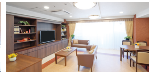
開放的なラウンジをはじめご入居者さまに心地よく お過ごしいただける共用スペース