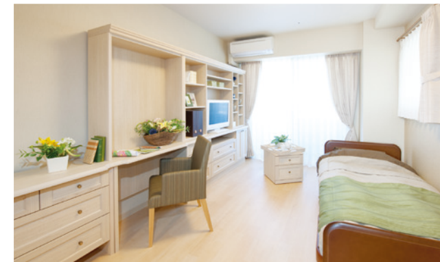
居室（モデルルーム）

お気に入りの家具を持ち込んでいただき、ご自分らしいインテリアで 楽しんでいただける居室。 たっぷりとする収納庫も備えております。 安心してお過ごしいただけるよう、緊急コールを各室、 トイレに設置し、車椅子の利用にも配慮しています。