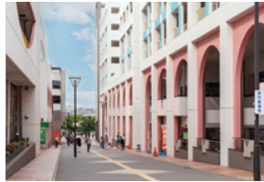
ホームストプラザ