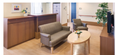
各階に完備されたリビングキッチン