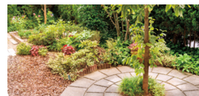
四季折々の彩りを楽しめる庭園