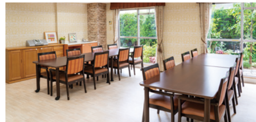
ご家族とのひとときをお愉しみいただけるファミリーダイニング