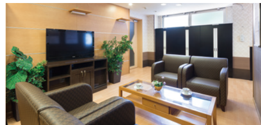
思い思いにお過ごしいただけるラウンジ