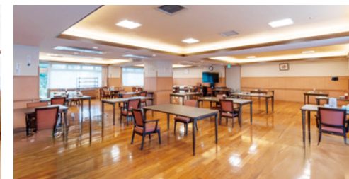
解放感のある広々としたダイニング（食堂）