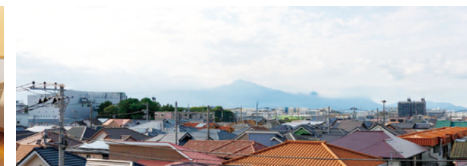
雄大な大山の眺望