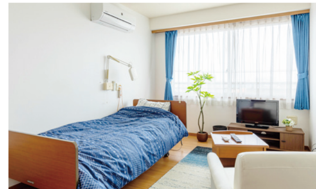
居室（モデルルーム）

お気に入りの家具を持ち込んでいただき、ご自分らしいインテリアで 楽しんでいただける居室。 たっぷりとする収納庫も備えております。 安心してお過ごしいただけるよう、緊急コールを各室、 トイレに設置し、車椅子の利用にも配慮しています。