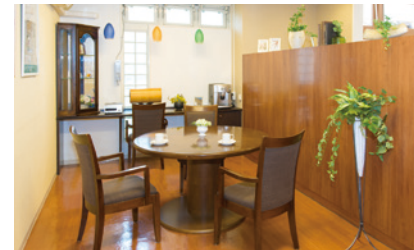
思い思いにお過ごしいただけるカフェ