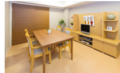
明るく落ち着いた雰囲気の相談室