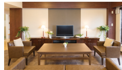
ご入居者さまの憩いの場となるラウンジ