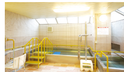
広々として開放的な大浴場