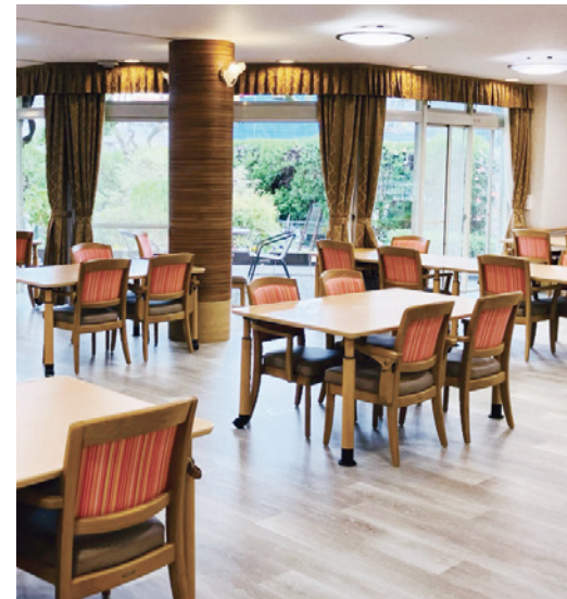
中庭に面した開放的なダイニングをはじめご入居者さまに心地よくお過ごしいただける共用スペース

ゆったりとしたダイニング（食堂）や思い思いに過ごせるカフェなど、日常的にゆとりと癒しを実感できる共用空間・設備をご用意しています。