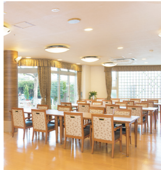
中庭に面した開放的なダイニングをはじめご入居者さまに心地よくお過ごしいただける共用スペース

ゆったりとしたダイニング（食堂）や思い思いに過ごせるカフェなど、日常的にゆとりと癒しを実感できる共用空間・設備をご用意しています。