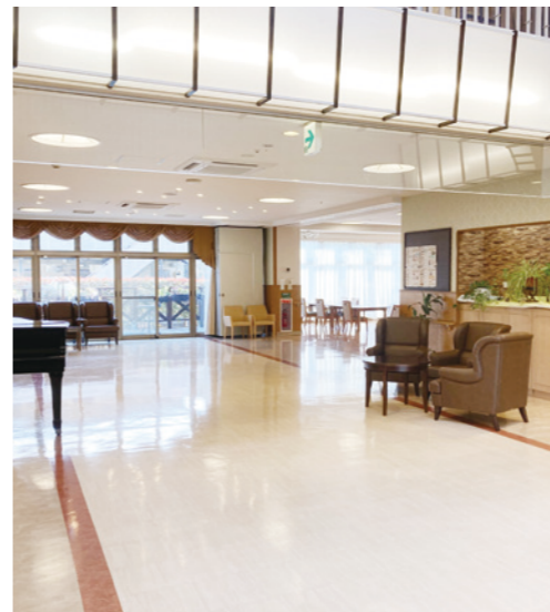
開放感あふれるロビーの吹抜

窓の大きなダイニング(食堂)や各階に設けたラウンジをはじめ日常的にゆとりと癒しを実感できる共用空間・設備をご用意しています。 「SOMPOケア ラヴィーレ大和」で、穏やかな暮らしをお愉しみください。