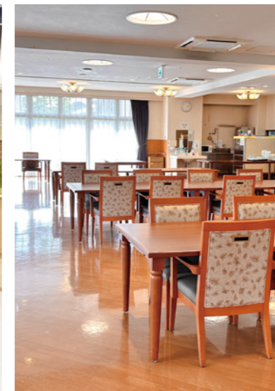
大きな窓から陽光が差し込む 明るさいっぱいのダイニング(食堂)