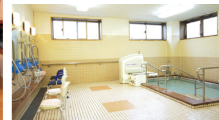
ゆったりとした気分で入れる大浴場