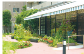
陽光やそよ風が気持ちよい中庭