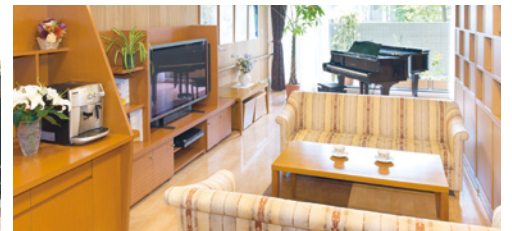
落ち着いた雰囲気です心地よいカフェ