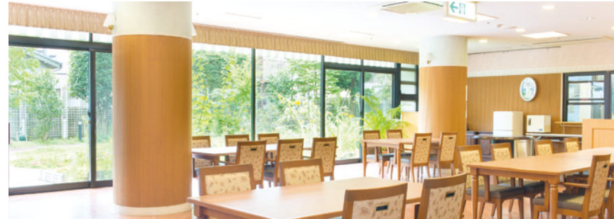
明るさいっぱいダイニングをはじめご入居者さまに心地よくお過ごしいただける共用スペース

ゆったりとしたダイニング（食堂）や思い思いに過ごせるカフェなど、 日常的にゆとりと癒しを実感できる共用空間・設備をご用意しています。