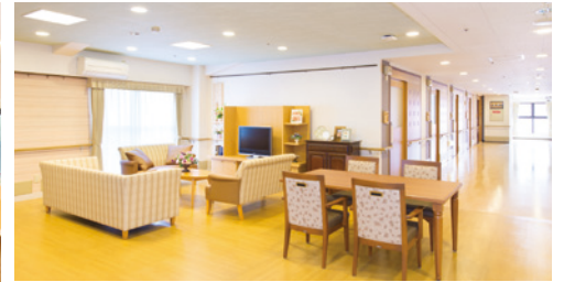
ご入居者さまの憩いの場となるラウンジ