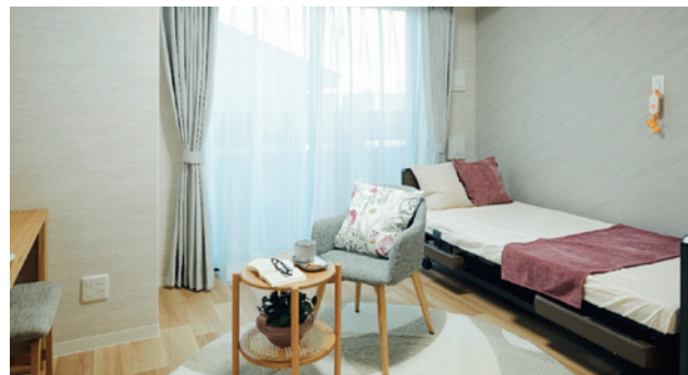
お気に入りの家具を持ち込める居室（モデルルーム）

安心してお過ごしいただけるよう、緊急コールを各室とトイレに設置し、車椅子のご利用にも配慮しています。