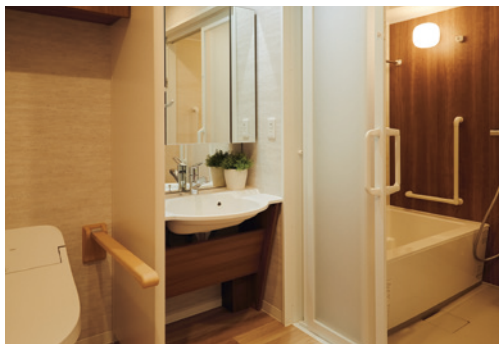
車椅子でも使いやすいトイレ・洗面台・浴室