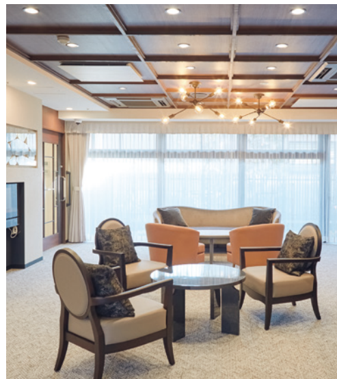
心地よくお過ごしいただけるカフェラウンジ

明るく開放的なダイニング(食堂)や思い思いに過ごせるカフェなど、 日常的にゆとりと癒しを実感できる共用空間・設備をご用意しています。