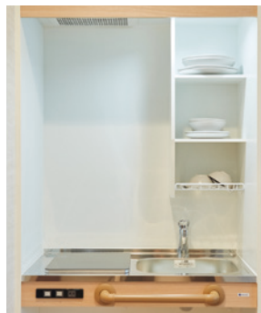
ミニキッチンを各室に設置