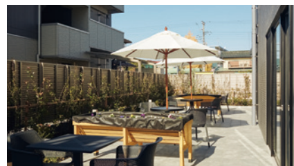
心地よい日差しが届くテラス