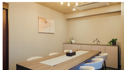
明るく落ち着いた雰囲気の相談室