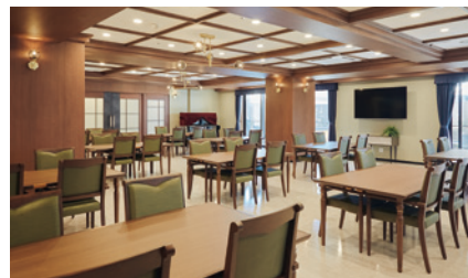
開放的なダイニング