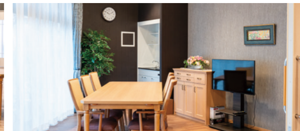
ご入居者さまとご家族さまの憩いの場となるファミリーダイニング