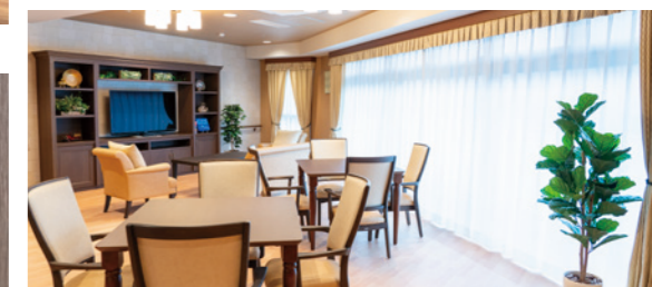
各階にあるご入居者さまがゆったりとした時間を過ごすラウンジ