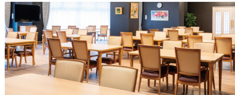
心地よくご利用いただける落ち着いた色調のダイニング

ご家族と食事を楽しむファミリーダイニングや各階に憩いの時間を過ごすラウンジ、 個別入浴室や理美容室など、快適で豊かなプライベート設備も充実しています。