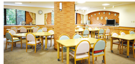
中庭に面した2面採光の開放的なダイニング