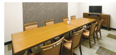
明るく落ち着いた雰囲気の相談室