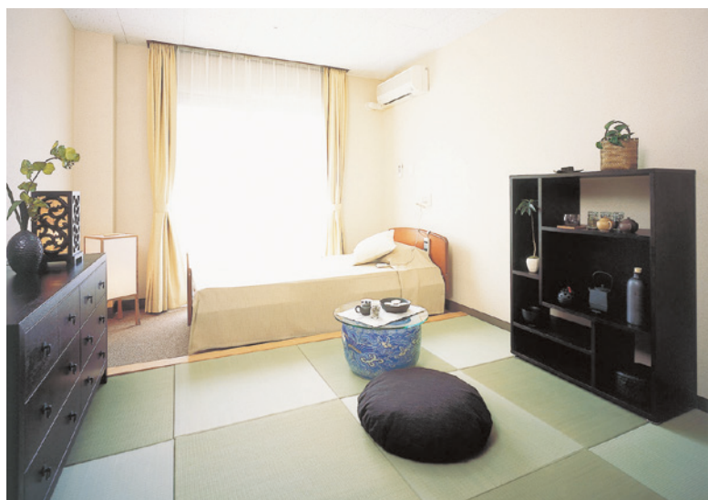
居室（モデルルーム）

お気に入りの家具を持ち込んでいただき、 ご自分らしいインテリアで楽しんでいただける居室。 安心してお過ごしいただけるよう、 緊急コールを各室、トイレに設置し、 車椅子の利用にも配慮しています。