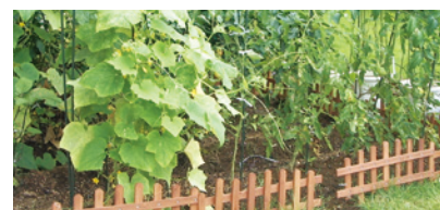
広々とした庭の一角、日当りの良い場所に 設けた農園