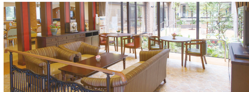
落ち着いたカフェをはじめご入居者さまに心地よくお過ごしいただける共用スペース

ホームの中心にある中庭に面したダイニング（食堂）や各階に設けたラウンジをはじめ、 日常的にゆとりと癒しを実感できる共用空間・設備をご用意しています。