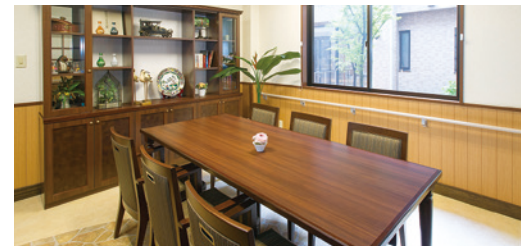
ご入居者さまの憩いの場となるラウンジ